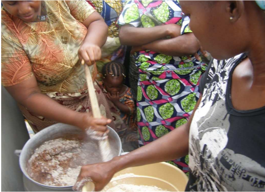
Séance de démonstration culinaire aux mères d'enfants

groupes d'aliments présents dans le plat. Au cours des visites à domicile, il s'agit aussi de vérifier la réalisation de ces mets par les mères.