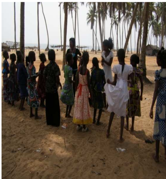
Fête de Noël aux enfants infectés à la plage de Ouidah