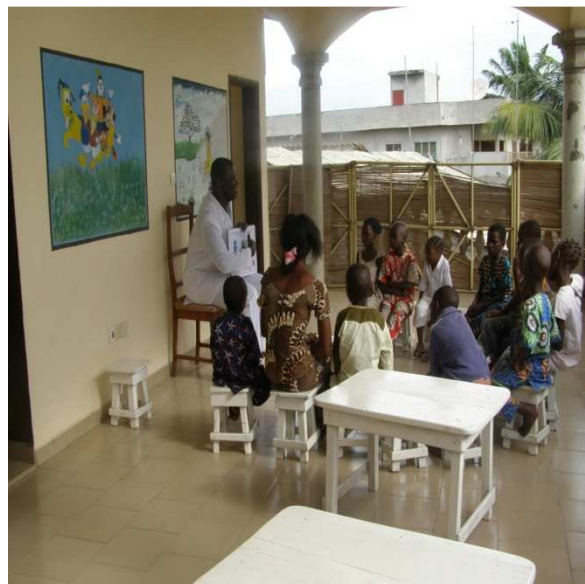
une séance d'éducation thérapeutique aux enfants sous ARV