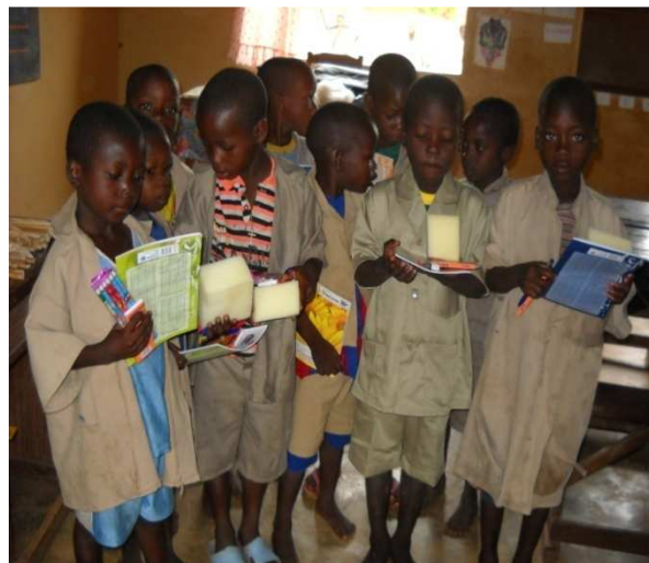
Distribution de fournitures scolaires

Par ailleurs, 210 enfants (dont 49 filles) à faible niveau de rendement scolaire, répartis en 21 groupes d'étude ont bénéficié de cours de soutien scolaire organisés et financés par RACINES et en partenariat avec les enseignants des écoles primaires.