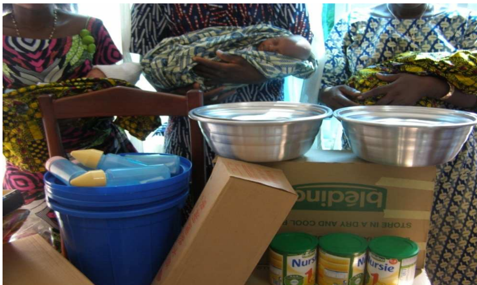
Don de lait et de matériels de préparation de lait aux mères d'enfants