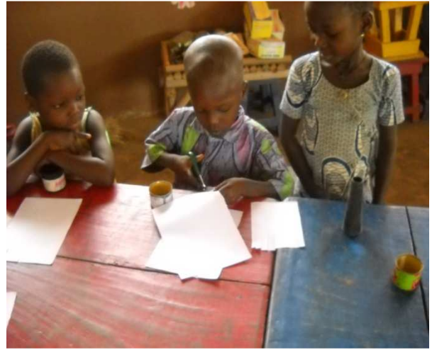
Atelier de fabrication de jeux