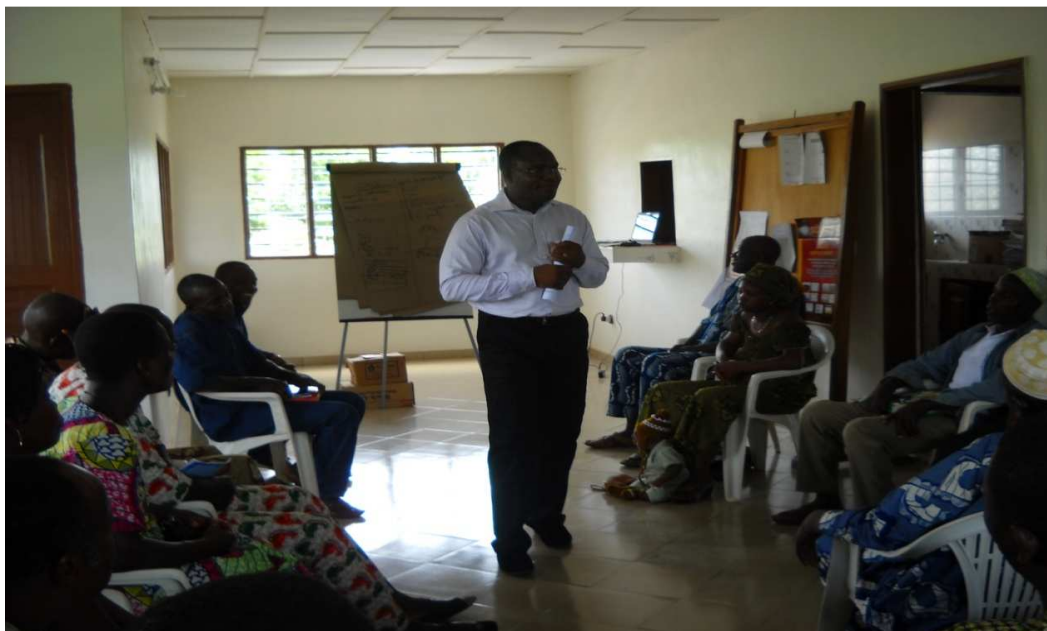
Formation des CVG sur les outils de gestion