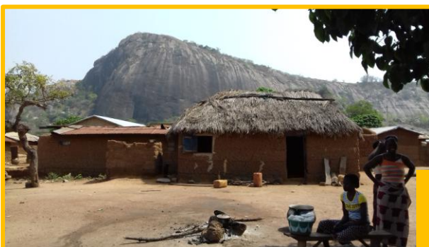
Le village de Minifi, au pied de la colline du Lion couché où nous avons eu la chance (sans trop avoir le choix) de discuter longuement avec le Roi local. Un vrai moment d'interculturalité !

Ce sont sur ces jolies photos que nous vous disons « Edabo », au-revoir, et à très vite pour la suite de nos aventures !