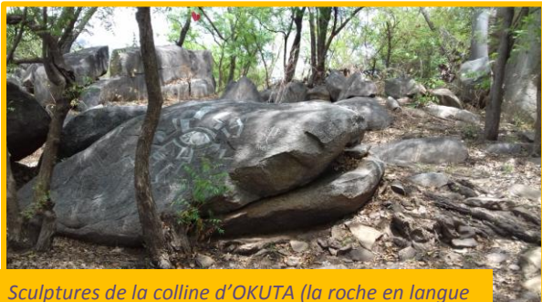
Sculptures de la colline d'OKUTA (la roche en langue Fongbé). Est-ce que vous voyez le serpent ?

Et puis pour nous, les deux volontaires, Savalou nous donne l'occasion d'aller découvrir les merveilles de la nature béninoise durant les week-ends. Nos excursions en moto-taxi (Zemidjan) nous amènent à la rencontre de nouvelles personnes et de paysages fascinants. Plusieurs collines siègent les environs, l'occasion pour nous de faire un peu de « grimpe » ... Mais si