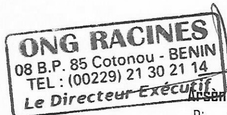
Arsène C. ADIFFON Directeur Exécutif

Type de contrat : Contrat à Durée Déterminée (CDD)