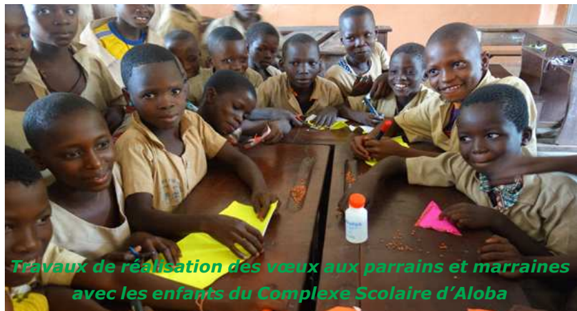
Travaux de réalisation des vœux aux parrains et marraines avec les enfants du Complexe Scolaire d'Aloba

Qu'elle soit une année remplie de Paix, de Joie, de Santé robuste, d'Amour et de Concrétisation des projets de chacun et tous !