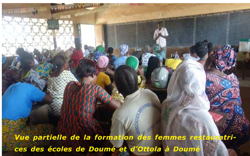
Vue partielle de la formation des femmes restauratrices des écoles de Doumé et d'Ottola à Doumé

Au début de cette année, la formation s'est focalisée sur les règles élémentaires d'hygiène et la technique de lavage des mains et des ustensiles. Plusieurs sous-thématiques ont été abordées au cours des sessions de formation et visaient à installer chez ces femmes des réflexes indispensables au maintien d'une bonne santé des enfants.