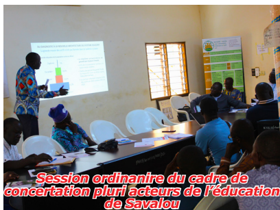
Session ordinaire du cadre de concertation pluri acteurs de l'éducation de Savalou

Les rencontres tenues dans le cadre de ce creuset ont déjà permis de dénouer un certain nombre de problèmes qui auraient eu plus de difficulté à être résolus sans le cadre. Il s'agit entre autres du règlement des conflits domaniaux entre les écoles