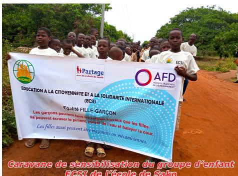
Caravane de sensibilisation du groupe d'enfant ECSI de l'école de Sako

Le premier est « Informer » qui consiste à former les enfants aux Objectifs de Développement Durable, à l'interculturalité, aux outils informatiques, aux échanges en visio-conférence et aux droits des enfants. Ensuite, ils apprennent à