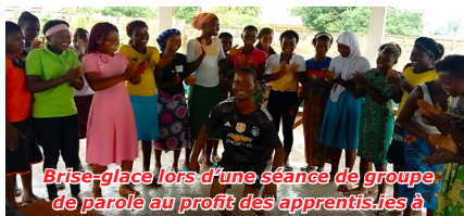
Brise-glace lors d'une séance de groupe de parole au profit des apprentis.es à Monkpad'atelier à Aglamidjodji